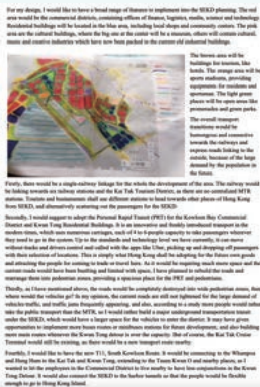
麥仲言 Rico (2017年為中學三年級) 12